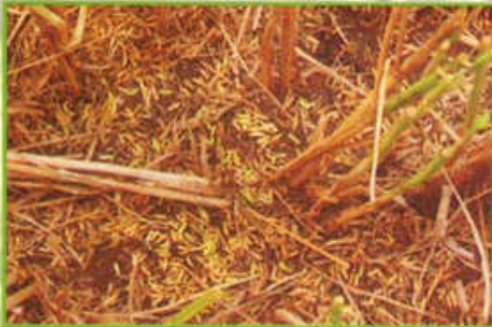
Biji padi angin di permukaan tanah.