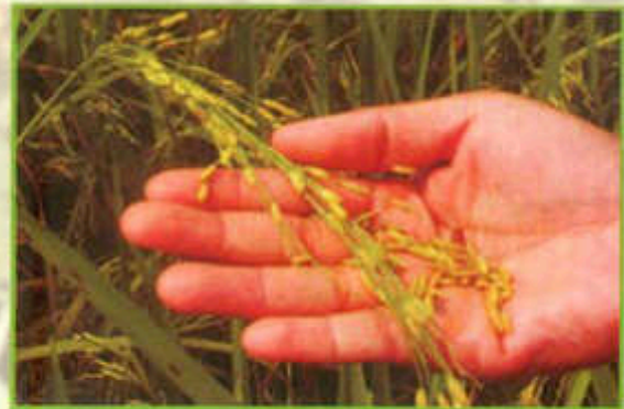
Biji padi mudah relai selepas digengam