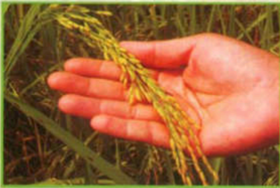
Tangkai padi angin