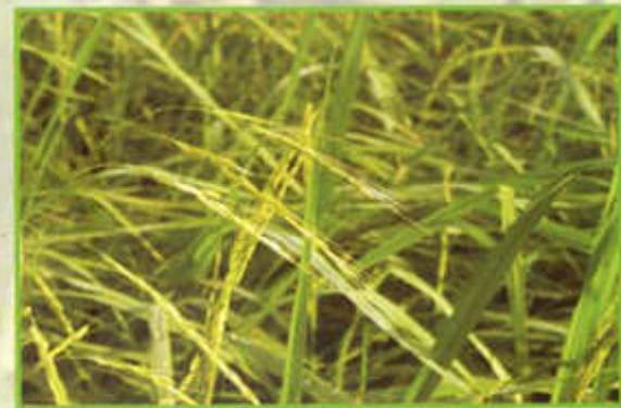
Biji benih berekor (awn)