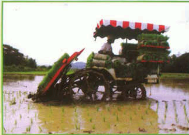
Menanam dengan jentanam

Padi angin dapat dikawal dengan baik di tempat-tempat yang mengamalkan tanaman secara mengubah.