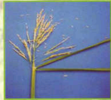
Daun pengasuh mendatar