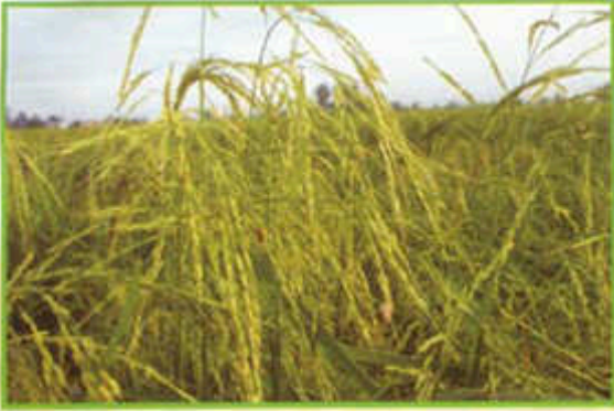
Padi angin lebih tinggi.