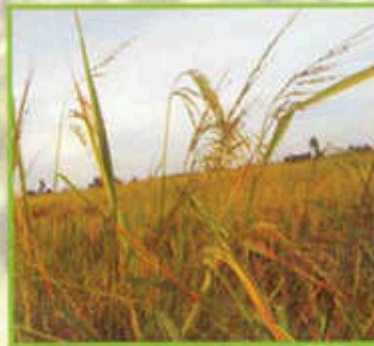
Daun pengasuh melentur