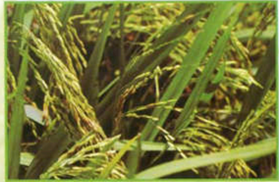
Padi angin sama tinggi.