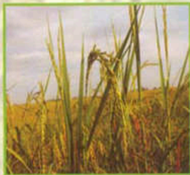
Daun pengasuh menegak