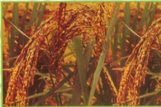
Biji padi berpigmen dan tangkai tertutup