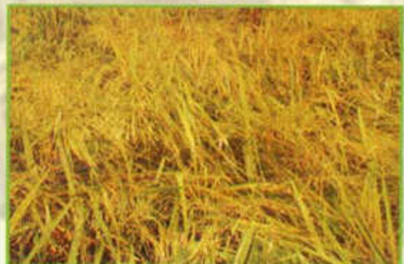
Tangkai padi angin yang bijinya gugur